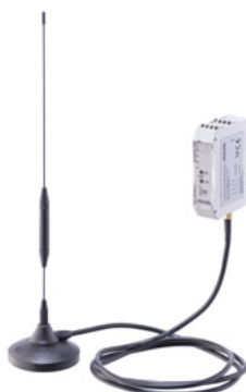
Trådlös mottagning (antenn + mottagare)