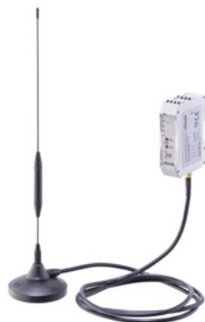
무선 수신기(안테나 + 수신기)