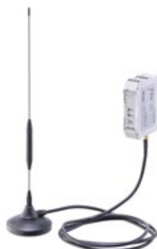
無線受信機 (アンテナ + 受信機)