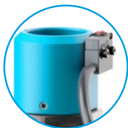
センサー付きモニタリング装置