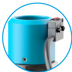
Unità di controllo con sensore