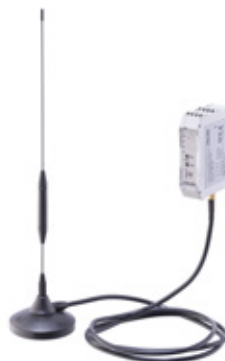
Langaton vastaanotin (antenni + vastaanotin)