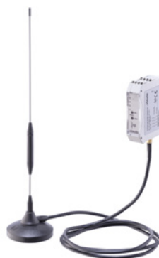
Funk-Empfänger (Antenne + Empfänger)